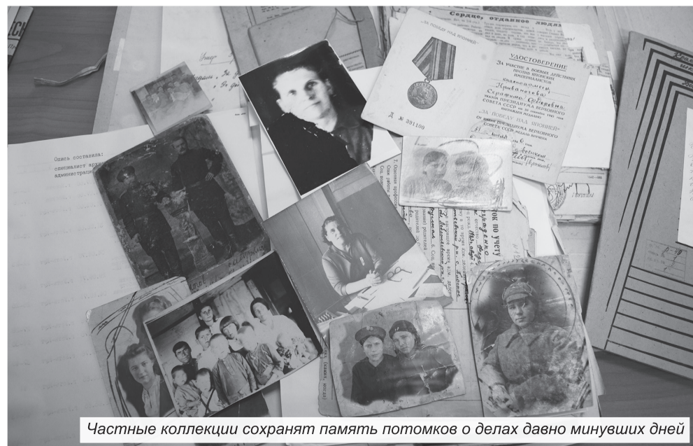
Частные коллекции сохраняют память потомков о делах давно минувших дней